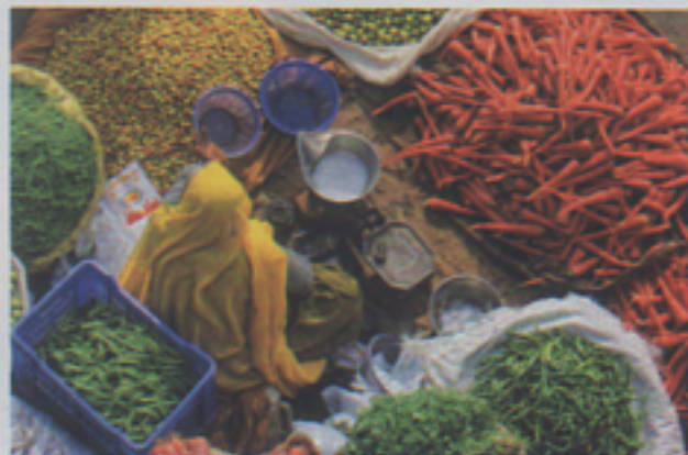
Il piatto forte di Jaipur sono le strade in technicolor. Sopra, il Choti Chaupar Market. In alto, l'Hawa Mahal o "Palazzo dei venti".

haveli - residenze signorili - in alberghi). Il colpo d'occhio, dal lago, è da restare abbagliati. La città brilla di bianco: lattiginoso quello del megapalazzo, opaco per l'isola-giardino di Jag Mandir, candido quello del palazzo "galleggiante" già residenza estiva del maharaja oggi sede del Taj Lake Palace (tajhotels.com).